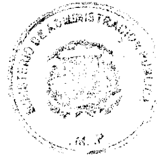
Lic. Ramón Ventura Camejo Ministro de Administración Pública

En Santo Domingo, Distrito Nacional, Capital de la República Dominicana a los veinte (20) días del mes de julio del año dos mil quince (2015).